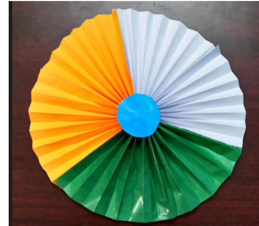
Nakulan, Grade 2