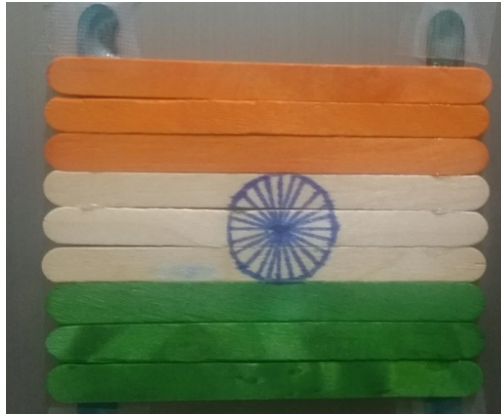
Shreyas, Grade 1