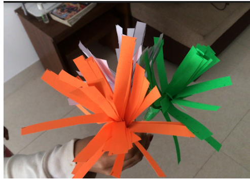
Aanya, Grade 3